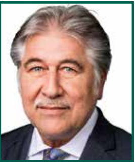
Theodor Förster, AfD, Fraktionsspr.