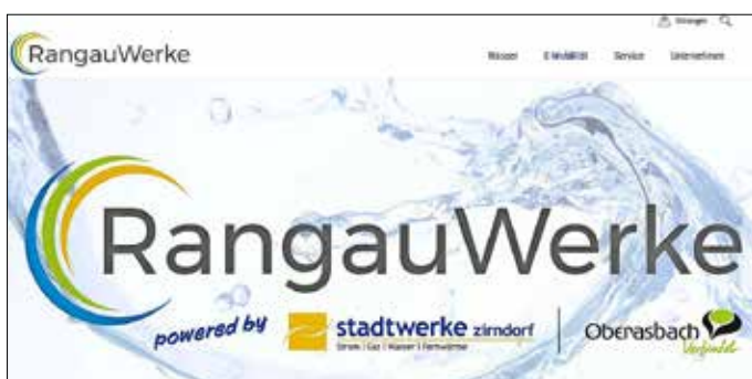
Die Startseite von www.rangauwerke.de

Die täglich und rund um die Uhr erreichbare Notrufnummer bei Störungen der Wasserversorgung bleibt wie bisher: 0911 60 90 41