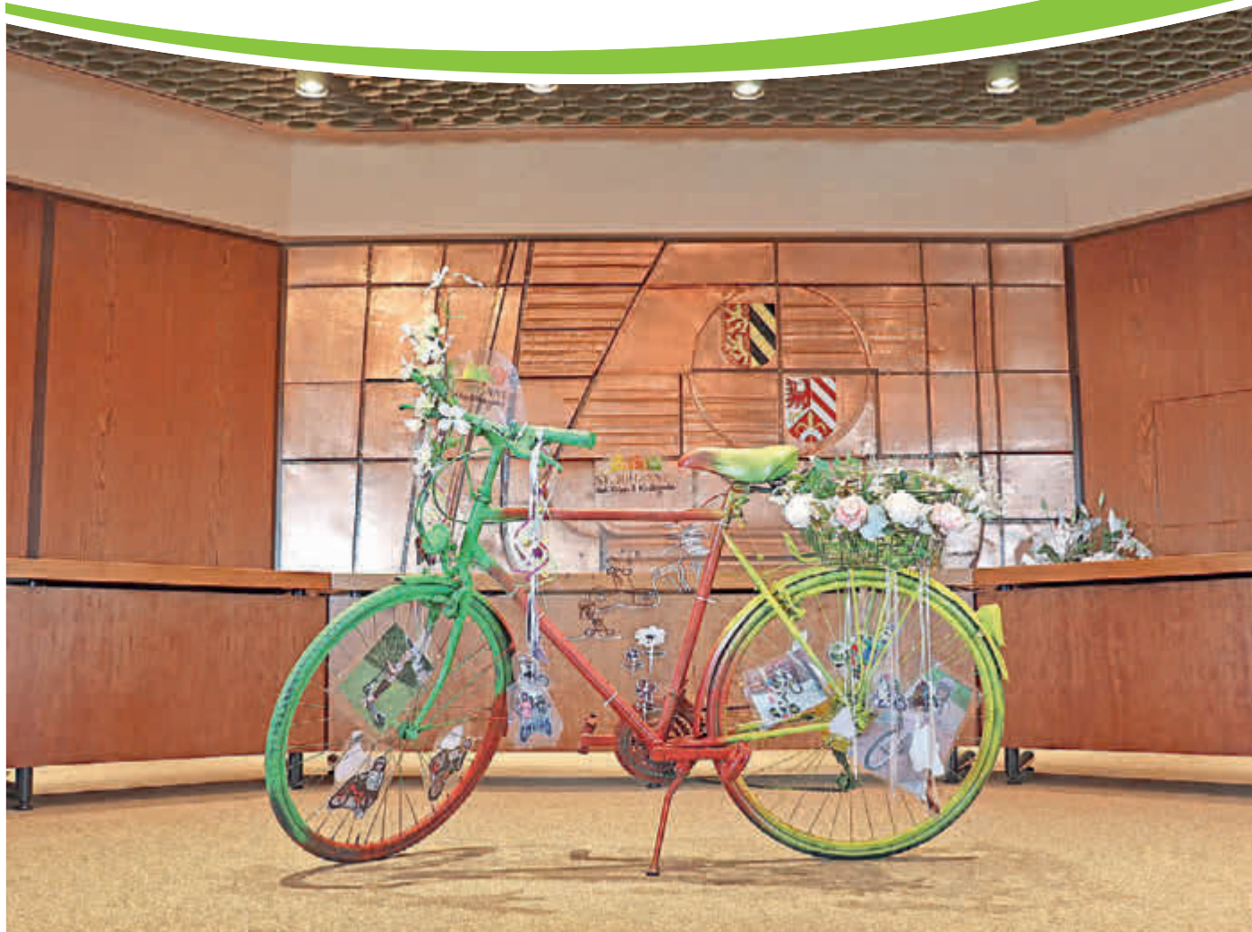
„Bürgermeister-Dienstfahrrad“ gestaltet vom Kindergarten St. Johannes