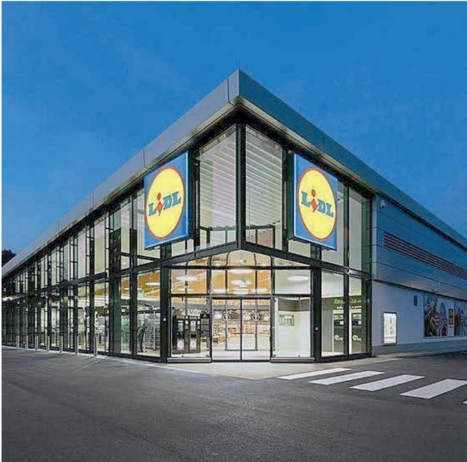
Beispielfoto einer Lidl-Filiale der aktuellen Generation.