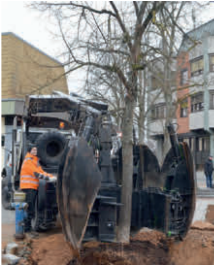
Das Spezialwerkzeug wird angesetzt...

Am Vormittag des 1. Februar rückte ein auf Großbaumverpflanzungen spezialisiertes Unternehmen mit Spezialgerät am Platz hinter dem Rathaus an und widmete sich einer Linde neben dem Rathausbrunnen.