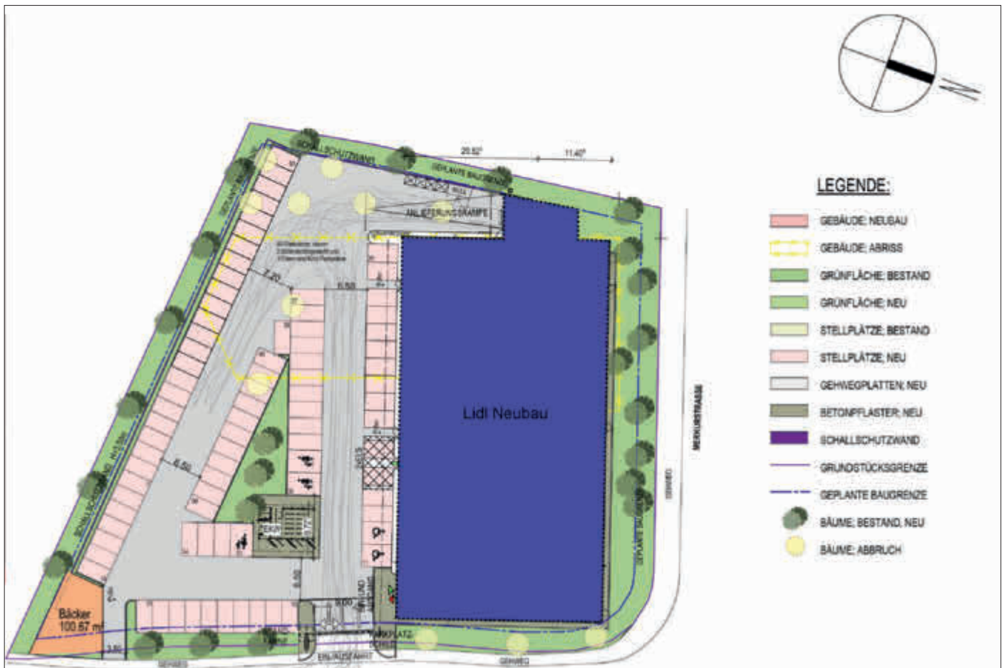
Planungsskizze der um 90 Grad gedrehten Lidl-Filiale

Moderne Einkaufsstätte mit attraktiven Einkaufsbedingungen