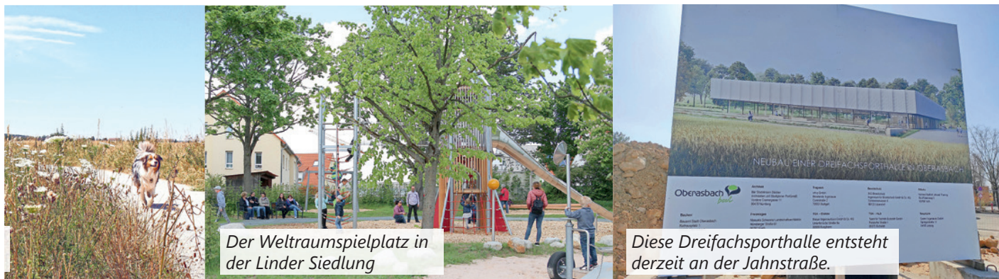
Der Weltraumspielplatz in der Linder Siedlung