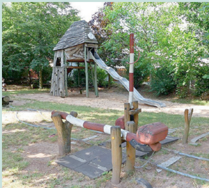
Die Eisenbahn ist ein zentrales Element auf dem Spielplatz