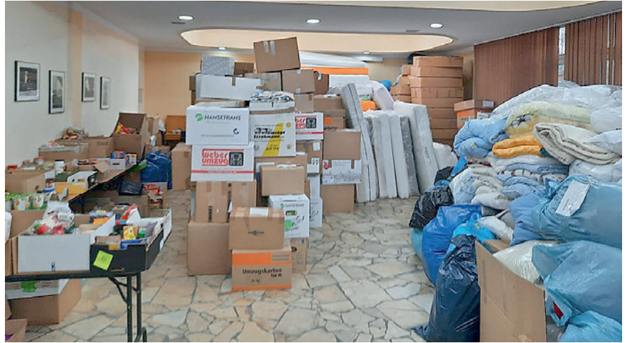
Die Vielzahl der Hilfsgüter werden im Kulturzentrum in Olawa zwischengelagert.