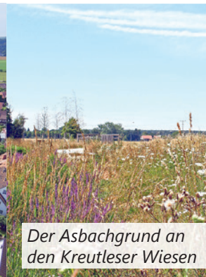
Der Asbachgrund an den Kreutleser Wiesen

Oberasbach verbindet viele Vorzüge des Landlebens mit den Annehmlichkeiten einer urbanen Infrastruktur in der Metropolregion. Unsere Stadt soll auch in Zukunft ein Wohnstandort mit hoher Lebensqualität bleiben – dazu dient das in weiten Teilen umgesetzte Stadtentwicklungskonzept von 2011. Jetzt stehen eine Überprüfung und Erweiterung der damaligen Strategie an. Machen Sie mit und schicken Sie uns bis 19. April Ihre Ideen für Oberasbach!