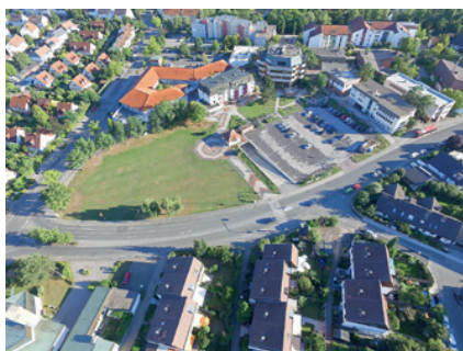
Das Areal vor dem Rathaus vor der Sanierung im Sommer 2016

In den letzten elf Jahren hat sich viel getan bei uns: Sie können jetzt zum Beispiel Veranstaltungen wie das Stadtfest, ein Foodtruck-Festival oder den Weihnachtsmarkt auf dem im Dezember 2018 eingeweihten Multifunktionsplatz vor dem Rathaus besuchen und kostenlos in der öffentlichen Tiefgarage unter dem neuen Rathausplatz parken. Sie können durch das Grün für alle am Ende