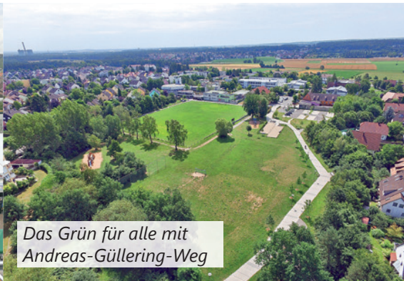
Das Grün für alle mit Andreas-Güllering-Weg