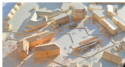
So könnte der Rathausplatz mit den sog. Ergänzungsbauten auf der ehemaligen Festwiese aussehen (Foto und Modell: Architekten Franke + Messmer u. Landschaftsarchitekt Taurorat)

Für die grundlegende Bestandsaufnahme zum Stadtentwicklungskonzept 2.0 sind Sie mit Ihrer Ortskenntnis gefragt! Seit Mitte März läuft eine Bürgerumfrage, an der Sie sich noch bis 19. April beteiligen können. Alle Infos dazu finden Sie im Kasten rechts. Angaben zur Wohnsituation sind hier ebenso von Interesse wie zum Mobilitäts- und Freizeitverhalten, um die weiteren Prioritäten des Stadtentwicklungskonzeptes festlegen zu können.