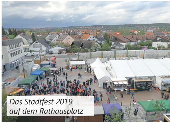
Das Stadtfest 2019 auf dem Rathausplatz

Ihr Beitrag zum Stadtentwicklungskonzept ist jetzt gefragt!