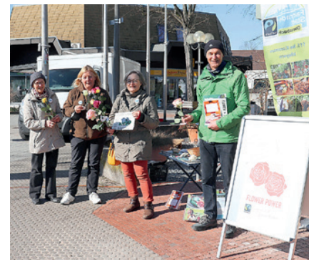
Der Aktionskreis Fairtrade verteilte faire Rosen und Infomaterial.

Wer sich in Oberasbach für Fairen Handel einsetzt, können Sie der Homepage www.fairtrade-oberasbach.de des Aktionskreises Fairtrade entnehmen.