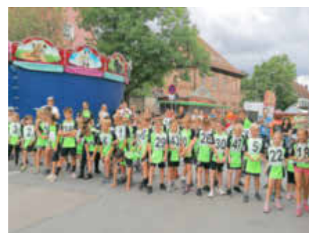
Die Teilnehmer des Schülerlaufs 2022