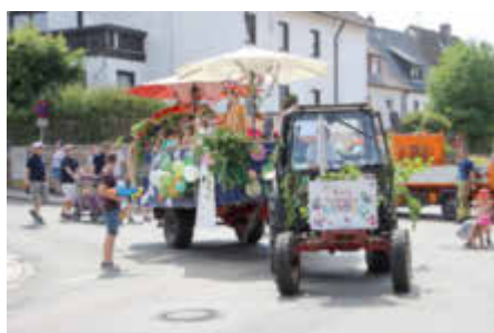
Den schönsten Wagen präsentierte der Kindergarten Regenbogen.