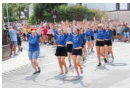
Die schönste und größte Fußgruppe stellte der TSV Altenberg.

auf Platz zwei der Festwagen der Stammtischgesellschaft Unterasbach sowie der Festwagen der Kärwaboum Oberasbach, gefolgt von den Kärwaburschen & Madli aus Weiherhof. Bei den Fußgruppen überzeugte die Jury am meisten der TSV Altenberg, der mit rund 300 Teilnehmern am