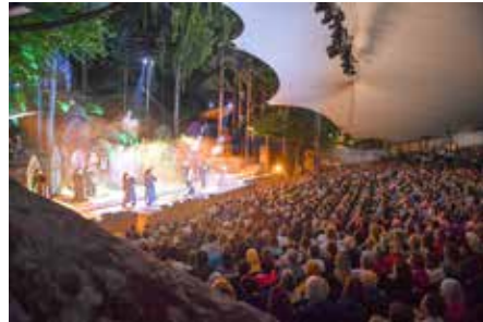
„Sister Act“ bei den Luisenburg-Festspielen