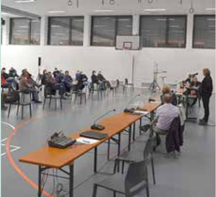
Letztjährige Bürgerversammlung unter Corona-Bedingungen