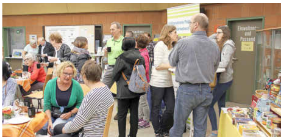
Das beliebte faire Pop-up-Café im Rathausfoyer

fand. Auch bei zahlreichen anderen städtischen Veranstaltungen leistet der AK seit mehr als sieben Jahren einen Beitrag und bringt den Gästen faire Produkte näher. Wichtig sind auch die vielen Filmvorführungen, Vorträge und Ausstellungen, mit denen der Aktionskreis die Bevölkerung für den Fairen Handel und Nachhaltigkeitsaspekte sensibilisieren möchte. Besondere Aktionen gibt es regelmäßig auch zur Fairen Woche, die sich dieses Jahr vom 15. bis 29. September dem Schwerpunkt „Klimagerechtigkeit“ widmen wird. Letztes Jahr ging es unter dem Motto „Fair steht dir“ darum, die Aufmerksamkeit der Verbraucher auf die Bedingungen in der Textilproduktion,