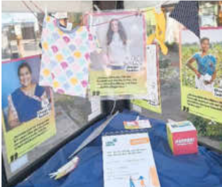
Im Fairtrade-Schaukasten im Rathausumfeld gab es zuletzt Informationen zu fairer Mode.