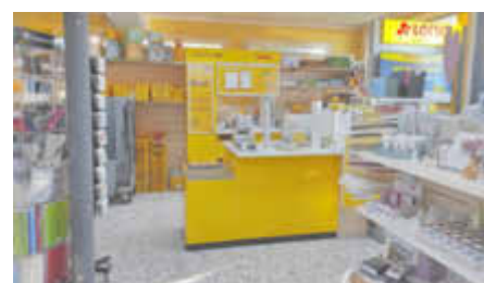
Blick auf den neugestalteten Post-Bereich

Mo – Fr 8.00 – 18.00 Uhr Sa 8.00 – 13.00 Uhr