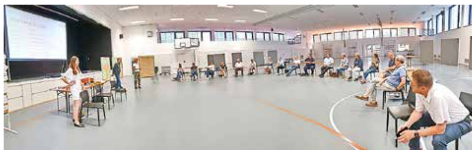
Die Fachplaner und Mitglieder des Stadtrats bei einem ISEK-Workshop im Mai 2022 in der Jahnhalle

angebotenen Format ISEK-Radtour, das fortgeführt werden soll, an von der Stadt organisierten Exkursionen zu Beispielprojekten oder dem Besuch von Vortragsangeboten z. B. zu energetischen bzw. altersgerechten Sanierungen, Nachverdichtung im Bestand oder Flächenaktivierung.