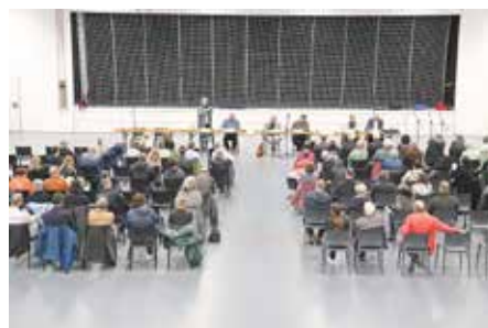
Über 80 Bürgerinnen und Bürger fanden sich in der Jahnhalle ein.

Aus dem Publikum kamen zahlreiche Fragen zur sozialen Struktur der Untergebrachten und der weiteren Vorgehensweise, vor allem aber belasten einige Bürgerinnen und