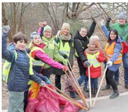
Einer für alle, alle für einen: „Musketiere“ der GS Altenberg waren im Hainberg fleißig.

Organisiert in 20 Gruppen haben sagenhafte 289 Oberasbacherinnen und Oberasbacher jeden Alters am Samstag, 11. März, an der Aktion „Saubere Landschaft“ teilgenommen.