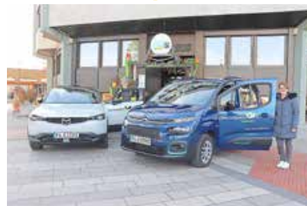
Das sind die beiden „neuen“ vollelektrischen Stadtfahrzeuge.

den Elektroautos auch über Dienst-Elektrofahrräder, die die Bauhof- und Verwaltungsmitarbeiter vor allem für kurze Dienstwege nutzen können.