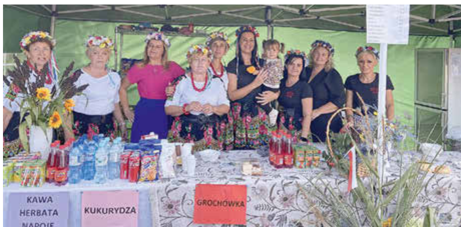
Die polnischen Landfrauen mit traditionellem Haarschmuck