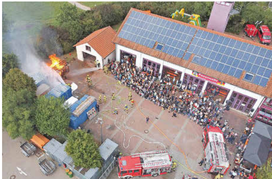
Die spektakuläre Abschlussübung mit einer brennenden Holzhütte