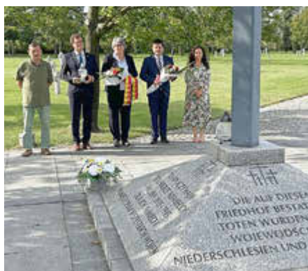
An der deutschen Kriegsgräberstätte Nadolice Wielkie (früher Groß-Nädlitz)

Dieses abwechslungsreiche Programm und gemeinsame Aktivitäten boten gute Gelegenheiten zu interessanten Gesprächen, die das Miteinander weiter fördern.