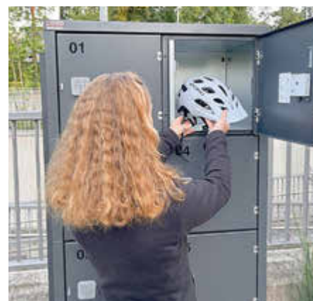
So ist der Helm sicher verwahrt und die Weiterfahrt mit dem Zug kann beginnen.

Nach Ihrer Rückkehr einfach den Code wieder eingeben, Tür öffnet sich automatisch, Helm entnehmen und die Tür unverschlossen zurücklassen, damit der nächste das Fach wieder nutzen kann.