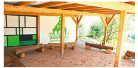
Die Kinder lieben das Freiluft-Klassenzimmer mit seinem rustikalen Mobiliar.

liebtheit. Doch die Werkstätten sind nur ein kleiner Teil des umfangreichen Aufgaben- und Leistungsumfangs der mudra. Als gemeinnütziger freier Träger bietet mudra ein breites Spektrum an ambulanten und stationären Angeboten in der Kinder- und Jugendhilfe, der Prävention und Drogenhilfe, Familienhilfe und Migrationsarbeit. Seine Angebote reichen von Überlebenshilfen, Gesundheitsfürsorge, Beratung für Betroffene und deren Angehörige, Betreuung und Begleitung bis hin zu therapeutischen Hilfen, Nachsorge, betreute Wohn- und Beschäftigungsangebote sowie berufliche Inklusions-, Integrations- und Qualifizierungsmaßnahmen. Zur Ausweitung der Zusammenarbeit wurden inzwischen zwei große Pflanztröge für die Verkehrsberuhigung der Faber-Castell-Straße in Unterasbach beschafft, die demnächst vom Bauhof bepflanzt werden. In der Hochstraße in Altenberg bzw. der Linder Siedlung werden weitere sechs folgen. Auch die mudra-Holzbänke im renaturierten Asbachgrund in der Sattlerwiese und den Kreutleser Wiesen erfreuen sich bei Spazier-