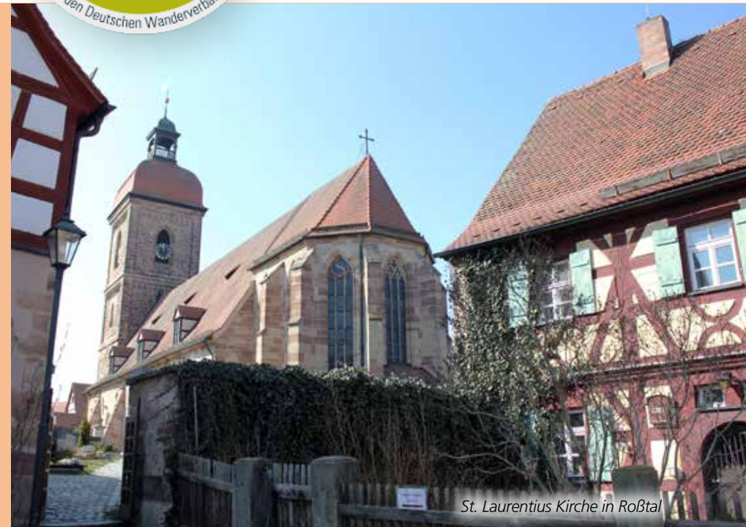
St. Laurentius Kirche in Roßtal