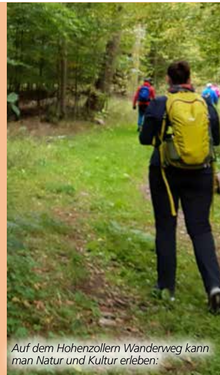
Auf dem Hohenzollern Wanderweg kann man Natur und Kultur erleben: