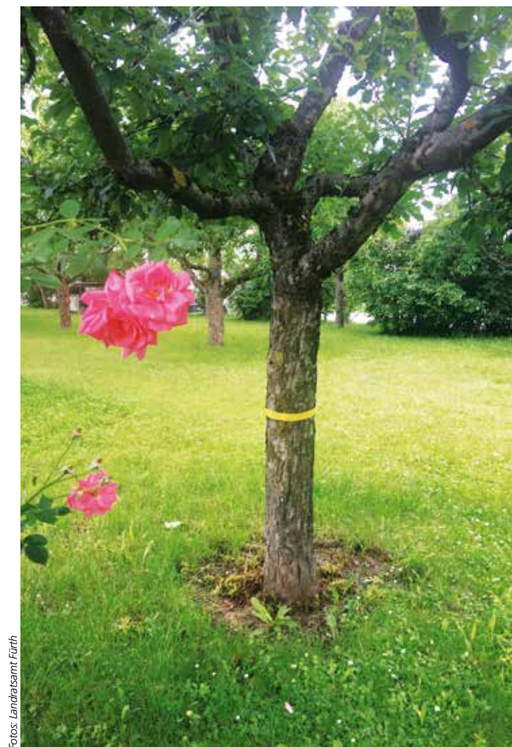
Das gelbe Band signalisiert: einfach ernten

Das Ernten der Obstbäume geschieht auf eigene Gefahr. Außerdem bitte pfleglich mit den Bäumen umgehen und keine Äste abbrechen, damit die Ernte auch im nächsten Jahr wieder ertragreich ausfallen wird.