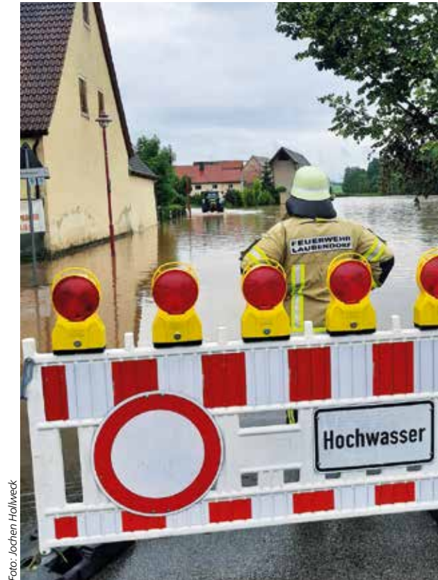
Das Hochwasser richtete in den Gemeinden entlang der Zenn Schäden an

Euro pro Haushalt/Hausrat beantragt wer-den. War Versicherungsschutz möglich, wur-de aber keine Versicherung abgeschlossen, beträgt die Soforthilfe bis zu 2.500 Euro. Außerdem gibt es eine Soforthilfe „Öl-schäden an Gebäuden“, um entstandene