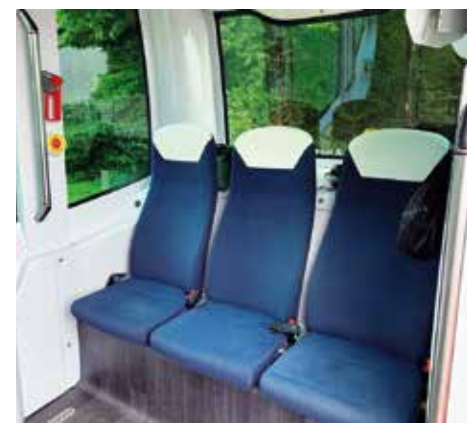
Er bietet Platz für bis zu acht Personen

Der autonom fahrende E-Bus kommt in Cadolzburg gut an: Alle, die an diesem Vormittag nach der etwa fünfminütigen Fahrt an der Haltestelle wieder aussteigen, sind begeistert. Ein Ehepaar aus Cadolzburg glaubt, dass in naher Zukunft solche Busse zum Tagesbild in vielen Regionen dazu gehören könnten. Ein 17-Jähriger, der mit seinem Vater, den Bus ausprobierte, ist danach erstaunt, dass der E-Bus mit einer Ladung bis zu acht Stunden fahren kann. „Das hätte ich nicht gedacht“, sagt er.