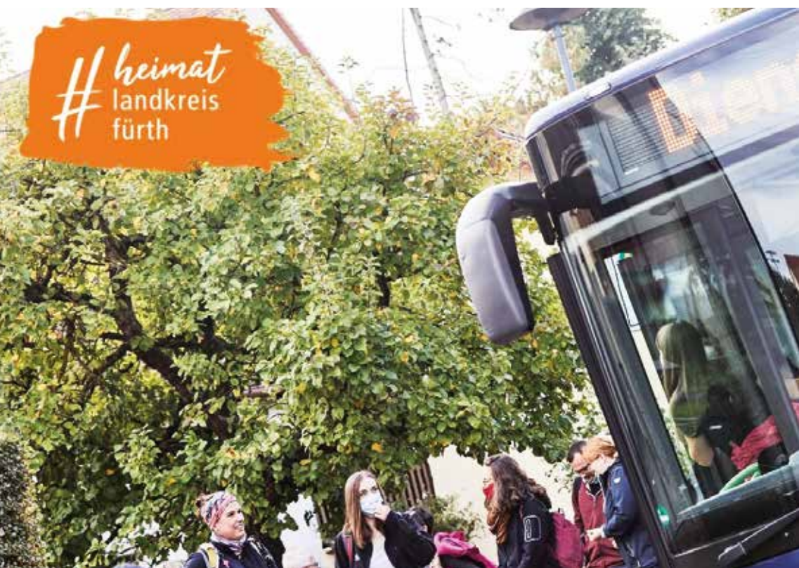
Einsteigen und den Landkreis erleben

Im Rahmen der Heimatkampagne #heimatlandkreisfuerth finden im September zwei Heimattouren statt. Die beiden thematischen Touren umfassen mehrere Stationen im Landkreis.