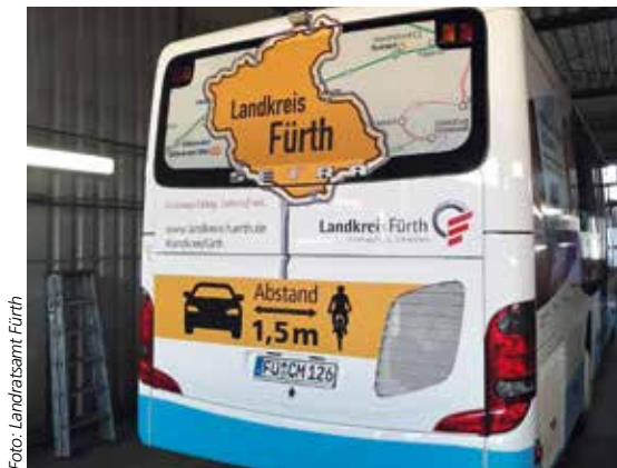
Das 365-Euro-Ticket für Schüler kann auch in Raten gezahlt werden

Voraussetzung für die Bestellung des 365-Euro-Tickets ist ein „Verbundpass Schüler und Auszubildende“. Wer diesen noch nicht besitzt, kann ihn beim Kauf des Tickets mitbestellen. Dafür ist ein ausgefüllter und unterschriebener Verbundpassantrag nötig, der die Berechtigung darstellt. Bei Tickets, die mit einer monatlichen Zahlungsweise gekauft werden, ist der Verbundpass seit diesem Jahr im Ticket integriert, so dass Fahrgäste kein zusätzliches Dokument mehr mit sich führen müssen. Bei der jährlichen