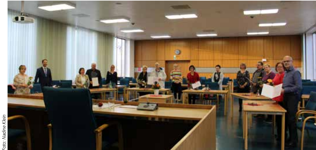
Ehrung im Landratsamt

Bei einer Ehrung im Landratsamt bedankte sich Landrat Matthias Dießl nun bei einigen Paaren und Familien, die schon besonders lange Pflegeeltern sind. Dabei wurden auch einige Pflegeeltern gewürdigt, deren Ehrung Corona bedingt im Jahr 2020 nicht stattfinden konnte. Sie wurden für ihr Zehn-, 15-, 20-, 25- und 30-jähriges Engagement geehrt. „Ich bin froh, dass es Sie alle gibt. Die eigene Familie zu vergrößern und ein Kind bei sich aufzunehmen verändert das Leben. Ihr eigenes, aber auch das Leben des Kindes, dem Sie ein Zuhause geben. Sie verschenken damit nicht nur Liebe und Zuneigung, sondern auch Perspektive und Hoffnung. Sie verändern das Leben eines oder einer Heranwachsenden. Dafür möchte ich Ihnen heute Danke sagen“, so der Landrat bei der Ehrung.