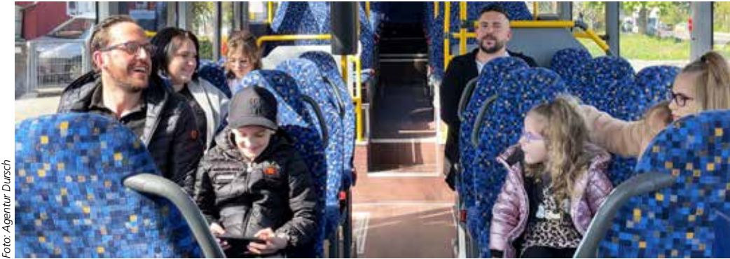
Entspannt unterwegs mit dem ÖPNV

Insgesamt betrachtet die Studie sieben Tarifmodelle, mit einer Gültigkeit für eine oder be-