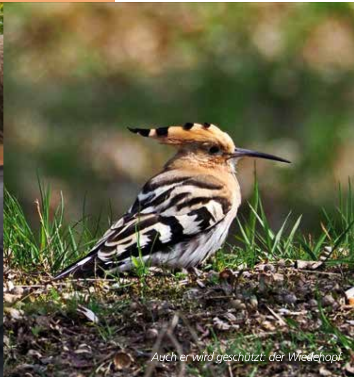
Auch er wird geschützt: der Wiedehopf