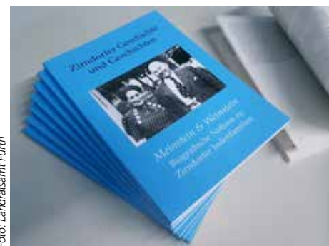
Nur noch wenige Exemplare erhältlich

Die Broschüre erscheint mit einer Förderung durch die Lokale Aktionsgruppe LEADER Region Landkreis Fürth. Sie wurde bei der Veranstaltung „Jüdisches Leben in Zirndorf“ vorgestellt und ist seitdem kostenlos im Städtischen Museum, in der Stadtbücherei, der Tourist-Information, der Bücherstube, im Rathaus und bei der Geschichtswerkstatt Zirndorf (Telefon 0911 - 60 16 88) erhältlich.