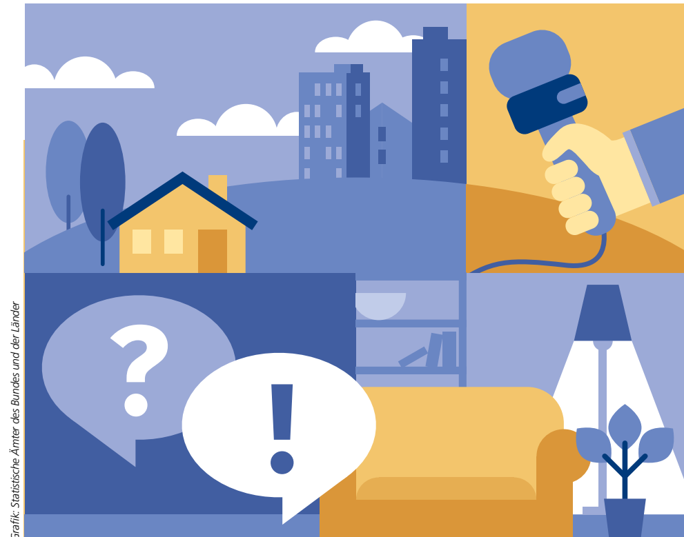
Grafik: Statistische Ämter des Bundes und der Länder