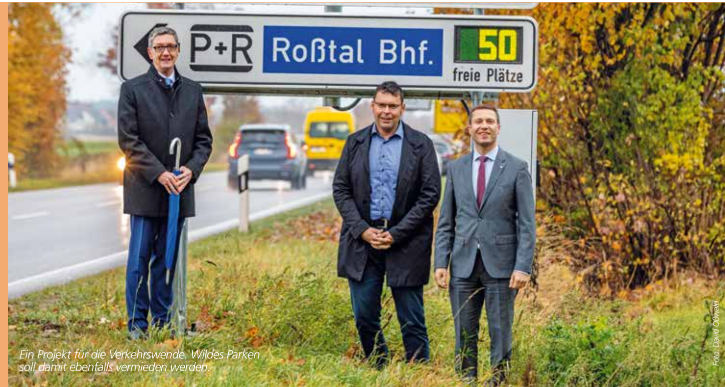
Ein Projekt für die Verkehrswende. Wildes Parken soll damit ebenfalls vermieden werden.

In der Region stehen zahlreiche Park+Ride (P+R)-Anlagen für den Umstieg vom Auto auf die Öffentlichen Verkehrsmittel zur Verfügung. Einige dieser Parkflächen sind rasch belegt, während andere über eine ausreichende Kapazität verfügen.