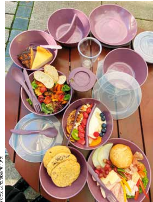
Das Mehrweggeschirr kann bis zu 200 Mal wieder verwendet werden

Ausleihe wird im Kassensystem verbucht. Bringen Gäste die gebrauchten Mehrwegbehälter zurück, bekommen sie das Pfand erstattet, die Rückgabe wird verbucht und die Box oder der Becher für die nächste Ausleihe gespült. „Wir finden das eine super Sache und auch bei den Gästen