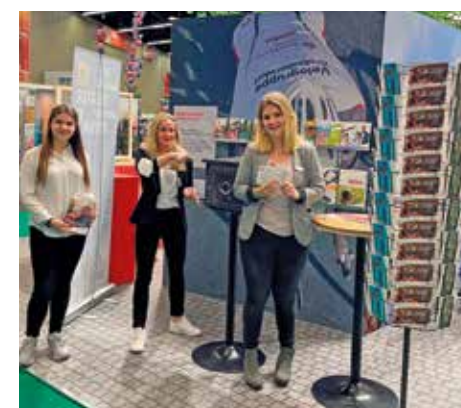
Die verschiedenen Aktionen kamen bei den Besuchern gut an

30. Okt. - 7. Nov. 2021 Messe Nürnberg Consumenta.de