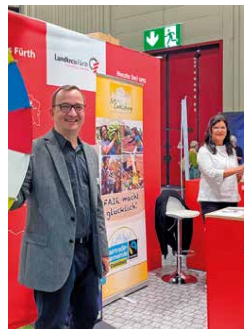
Buntes Programm am Stand des Landkreises