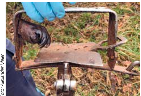
Solche verbotenen Fallen können Biber töten oder schwer verletzen

Das vorsätzliche Nachstellen – hierzu gehört bereits das bloße Anlocken oder Aufstellen einer Falle –, Fangen, Verletzen und Töten eines Bibers sind Straftaten, die mit Freiheitsstrafe bis zu fünf Jahren oder mit Geldstrafe geahndet werden. Dies gilt ebenso für die Beschädigung von Biberburgen und den bauschützenden Hauptdämmen.