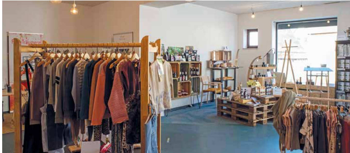
Inspiration für Weihnachtsgeschenke

Mit dem Projekt „ZeitRaum. Der RegionalStore“ ziehen individuelle und regionale Produkte sowie Designs von Labels aus dem Landkreis Fürth in einen Leerstand ein. Viele Ideen für Weihnachten: Einfach vorbeischaun und entdecken - Bekleidung, Accessoires, Möbeldesigns, Wohnaccessoires, Haushaltsprodukte, Regionale Schmanckerl. Und vieles mehr. Und alles aus unserem Landkreis.