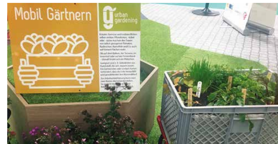
Unter anderem wurde "Urban Gardening" vorgestellt

An den Messetagen zeigten sich die Marktgemeinden Cadolzburg und Roßtal sowie die Städte Langenzenn, Stein und Zirndorf. Gut gefragt waren alle Programmpunkte. Beim Seniorentag gab es wertvolle Informationen zu den Themen Betreuungsangebote, Vorsorgevollmacht und Patientenverfügung.