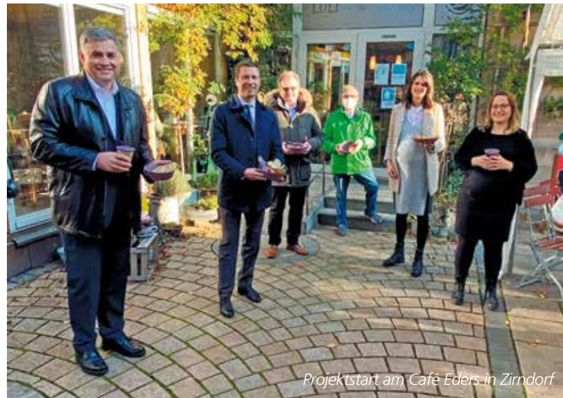
Projektstart am Café Eder in Zirndorf