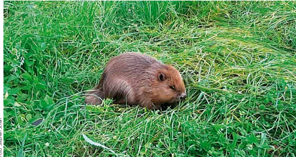
Wer einem Biber vorsätzlich nachstellt, begeht eine Straftat

Sobald solche Gefahrensituationen auffallen, ist es wichtig, unverzüglich den örtlichen Biberberater, die Untere Naturschutzbehörde am Landratsamt Fürth oder auch gleich die zuständigen Polizeidienststelle zu informieren.