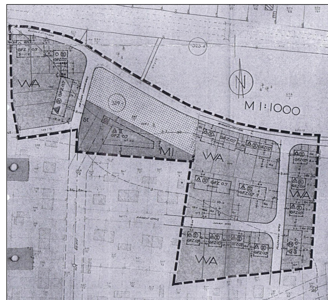
Rechtsverbindlicher Bebauungsplan Nrn. 66/6 und 67/1 "Birkenstraße, Platanenweg, Ahornweg"