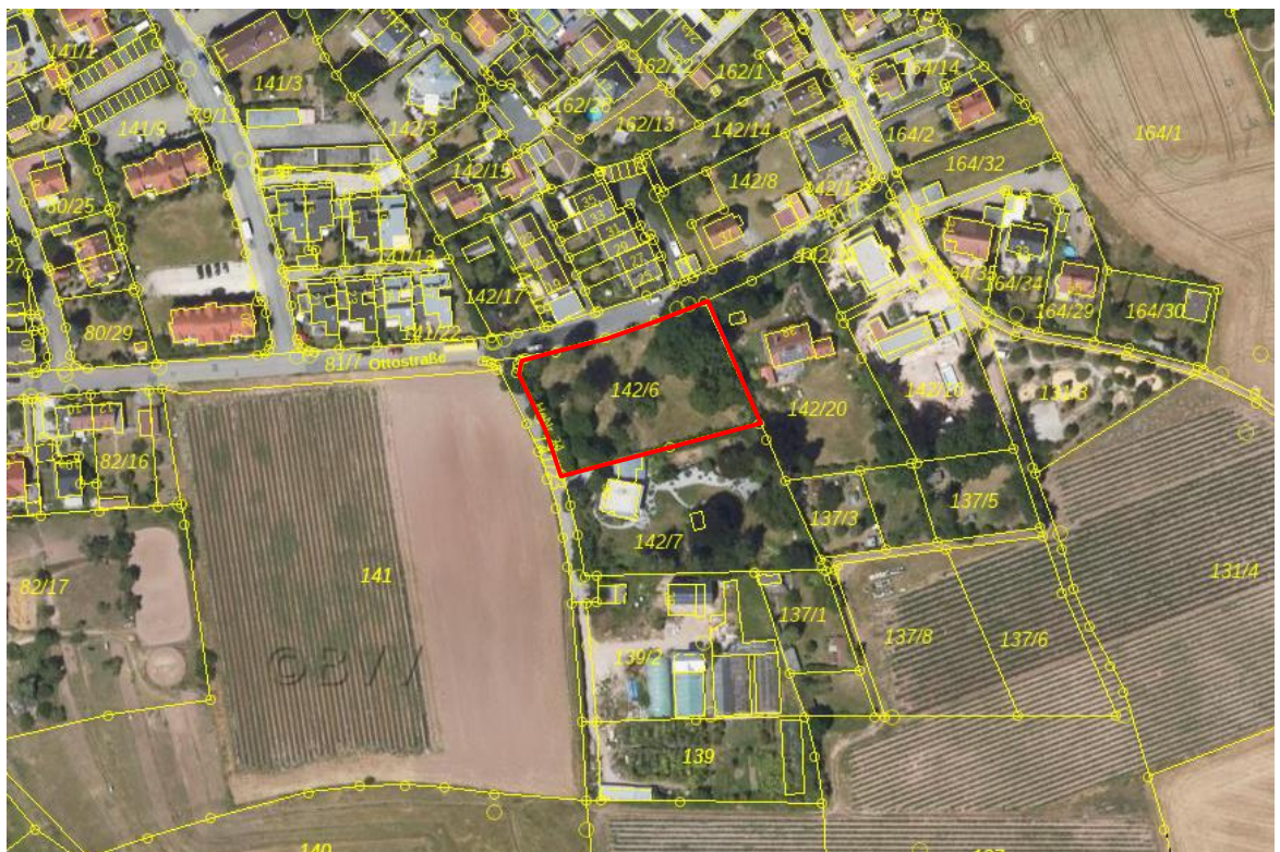
Luftbildkarte des Geltungsbereichs

Die äußere Erschließung des Gebietes erfolgt über die Ottostraße und/oder den Erschließungsstich (Fl.Nr. 141/23, Gemarkung Oberasbach) westlich des Plangebiets.