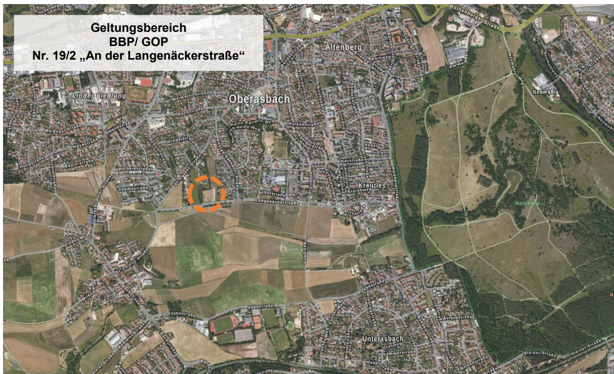
Lage des Geltungsbereichs des BBP & GOP Nr. 19/2 „An der Langenäckerstraße“ in Oberasbach (Bayerische Vermessungsverwaltung 2020, Landesamt für Digitalisierung, Breitband und Vermessung)

Der Geltungsbereich umfasst das Grundstück mit den Flurnummern Fl.-Nrn. 754 und 247/13 (TF) - alle Gemarkung Oberasbach, mit einer Gesamtfläche von 4021,087 m 2 (0,4 ha).