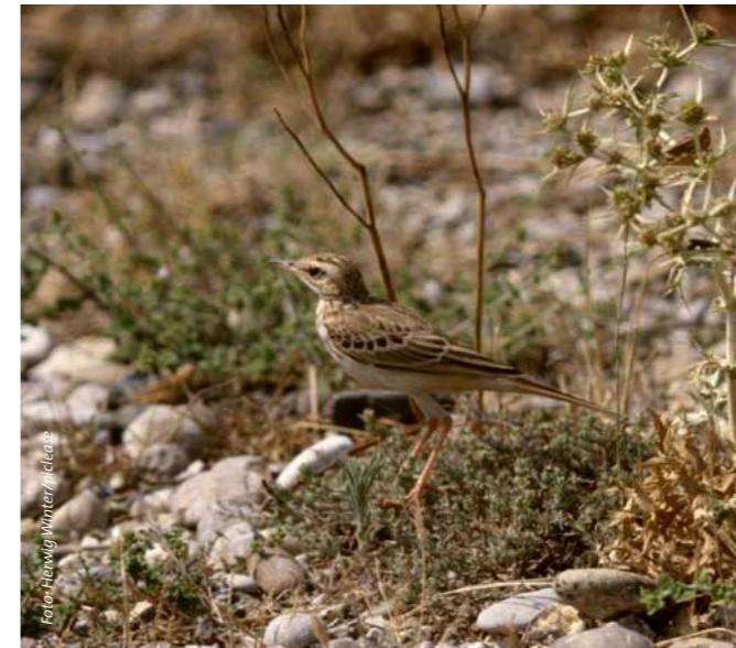
Das Naturschutzgebiet ist Lebensraum für bedrohte Arten wie den Brachpieper.

Mit rund 70 Prozent nimmt das Offenland den größten Teil der Naturerbefläche ein. Die Sandtrockenrasen mit ihren kurzen, lückigen Grasbeständen haben insbesondere für bodenbrütende Vögel wie den Brachpieper oder die Heidelerche eine lebenswichtige Bedeutung. Hier können sie ihre Feinde rechtzeitig erkennen und so ihren Nachwuchs schützen. Damit die Magerrasen nicht verbuschen, werden Schafe zur Beweidung eingesetzt: Herden mit bis zu 400 Tieren verbringen den Sommer auf dem Hainberg. Durch die Beweidung wird auch der Fortbestand der hier heimischen Pflanzen- und Insektenarten gesichert.