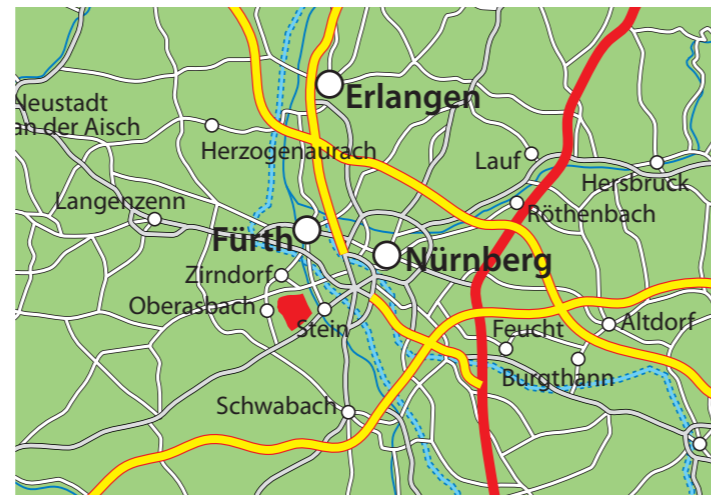
Rot markiert, das DBU Naturerbe Hainberg