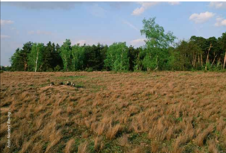
Auf der ehemaligen Militärfäche wechseln sich Gras- und Baumlandschaften ab.

Um das Nationale Naturerbe zu bewahren, übergibt die Bundesregierung in den nächsten Jahren rund 46.000 Hektar bedeutsame Flächen an die DBU Naturerbe GmbH, eine Tochter der Deutschen Bundesstiftung Umwelt (DBU). Die gemeinnützige GmbH wird die 33 ehemals militärisch genutzten Gebiete in neun Bundesländern dauerhaft für den Naturschutz sichern. Seit Juli 2010 ist sie Eigentümerin von fünf Naturerbeflächen in Bayern mit insgesamt rund 1.300 Hektar, darunter auch Hainberg in Mittelfranken. Offene Lebensräume im DBU Naturerbe werden durch Pflege bewahrt, Wälder zu neuer Wildnis entwickelt und Feuchtgebiete ökologisch aufgewertet. Die ortskundigen Bundesförster übernehmen im Auftrag der GmbH diese Aufgaben.