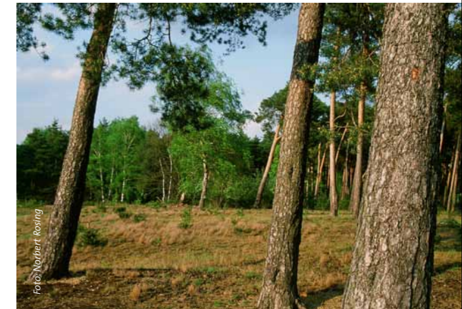
Reine Kiefernforste werden in Mischwäldern umgewandelt.

Ziel der DBU Naturerbe GmbH ist es, die Wälder auf dem Hainberg langfristig einer natürlichen Entwicklung zu überlassen.